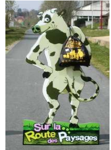
Le Kit Escapade