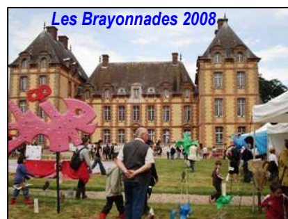
Les Brayonnades 2008