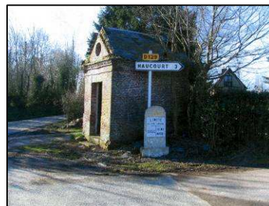
Petite chapelle rurale à Haucourt ayant fait l'objet d'un appel aux dons et d'une subvention de la Fondation du Patrimoine.

Aujourd'hui, l'Association Culturelle et Touristique du Pays de Bray et la Fondation du Patrimoine Délégation de Seine Maritime souhaitent associer leurs compétences pour valoriser le patrimoine rural du Pays du Bray .