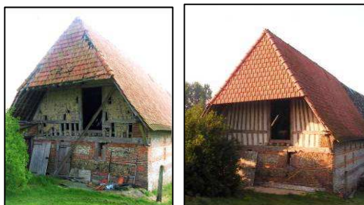
Photos avant/après travaux d'un ancien bâtiment agricole situé à Londinières