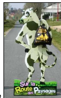
Le Kit Escapade